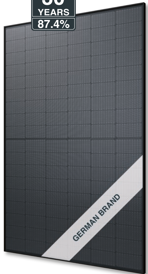
Abb. ähnlich 108TFMDE230316A